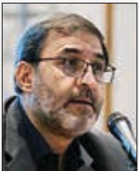
معاون سیاسی وزیر کشور؛

اسلام شد. تلاش دولت مردمی و عدالت محور برای رسیدگی به مسائل و خواسته‌های مردم از دیگر محورهای