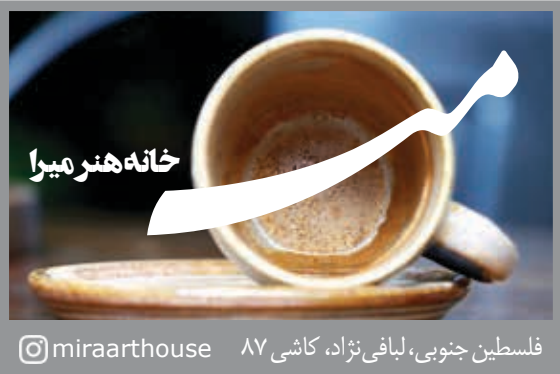
فلسطین جنوبی، لیافی نژاد، کاشی ۸۷ @miraarhouse