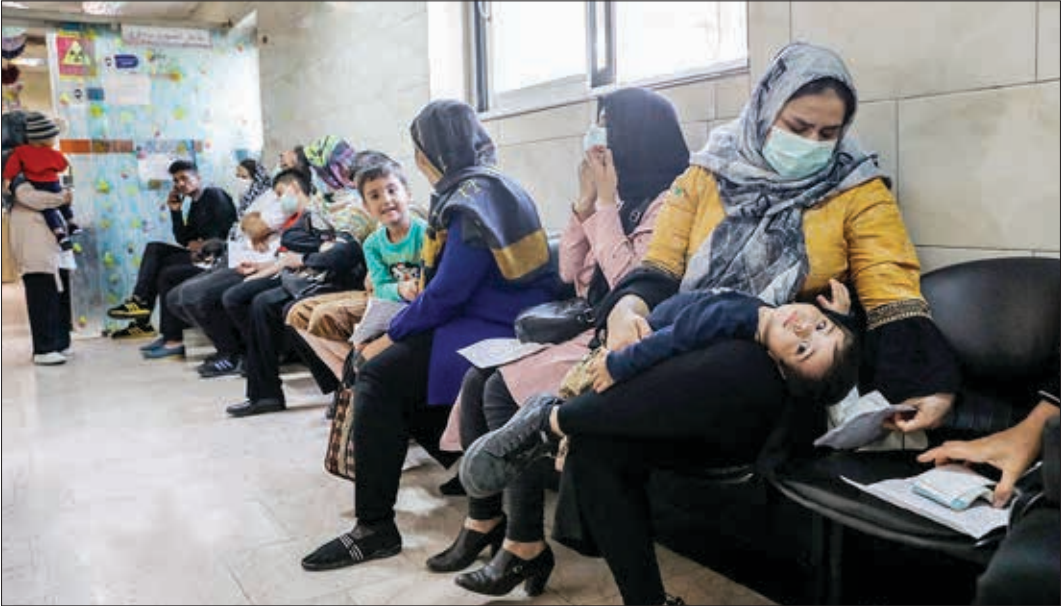
مدیرعامل شرکت توسعه و عمران آمل:

بیماری‌های ویروسی تأثیری ندارند، پرهیز و عدم حضور در اماکن عمومی و تجمعات.