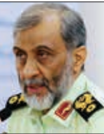
رییس سازمان غذا و دارو:

جانشین فراچا گفت: ما در کشوری زندگی می‌کنیم که پایه آن اسلام است و سنکاندار این نظام ولی ثقیه است که به فرموده بزرگواران ولایت فقیه همان ولایت رسول الله است. جمهوری اسلامی ایران سه قوا دارد و