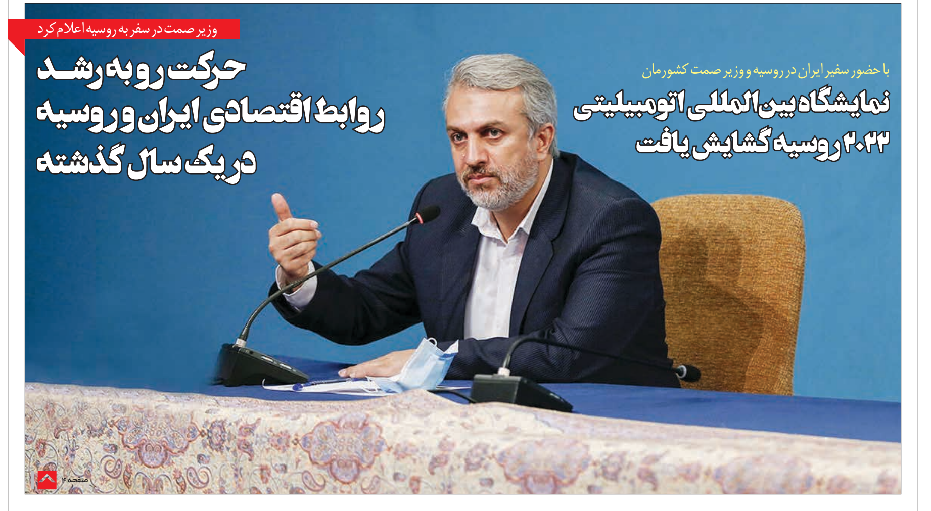
با حضور سفیر ایران در روسیه و وزیر صمت کشورمان