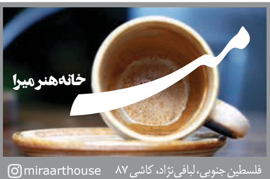
فلسطین جنوبی، لیافی نژاد، کاشی ۸۷ @miraarhouse