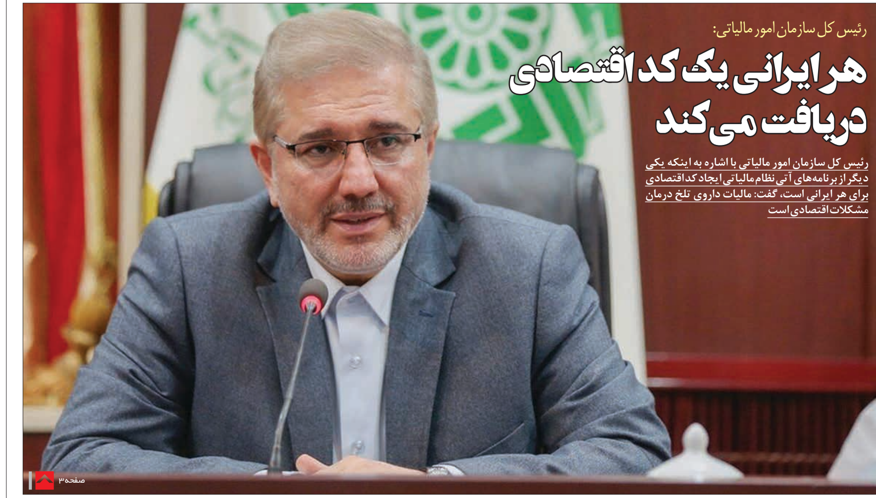
رئیس کل سازمان امور مالیاتی: