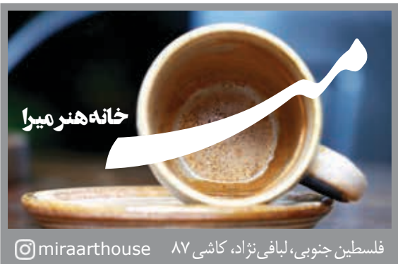
فلسطین جنوبی، لیبافی نژاد، کاشی ۸۷ @miraarhouse

کشورمان تأکید کرد و خواستار کمک دیوان محاسبات عراق در تحقق این موضوع شد. اجرائی سازی پروژه‌های مشترک در حوزه نفت به منظور استفاده از ذخایر و حفاظت از منابع مشترک نفتی و گازی و لزوم برنامه ریزی جهت نظارت بر نحوه اجرای پروژه‌ها از دیگر موضوعاتی بود که توسط رئیس کل دیوان محاسبات مطرح شد. رئیس دیوان محاسبات عراق با استقبال از پیشنهاد ایران مبنی بر تشکیل سازمان دیوان محاسبات‌های کشورهای جهان اسلام، این اقدام را حرکتی جدید در هم‌افزایی میان دستگاه‌های نظارتی مالی و انتقال تجربیات قلمداد کرد.