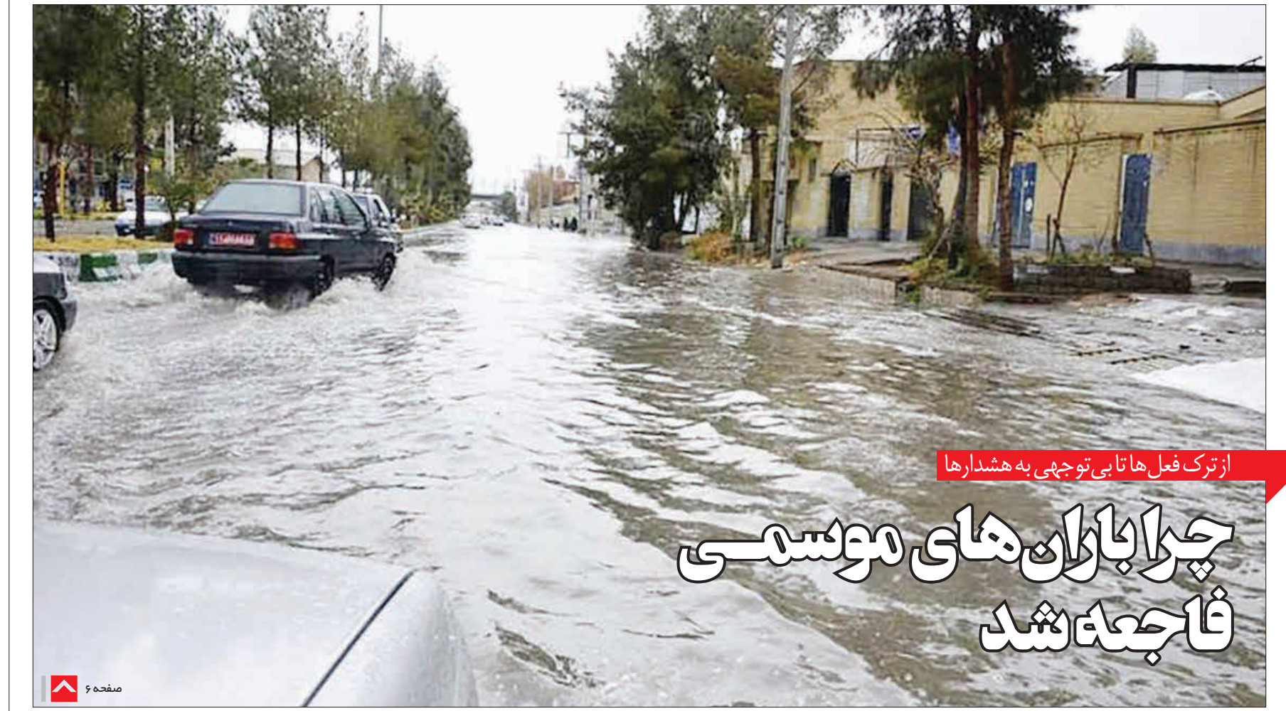
از ترک فعل ها تا بی توجهی به هشدارها