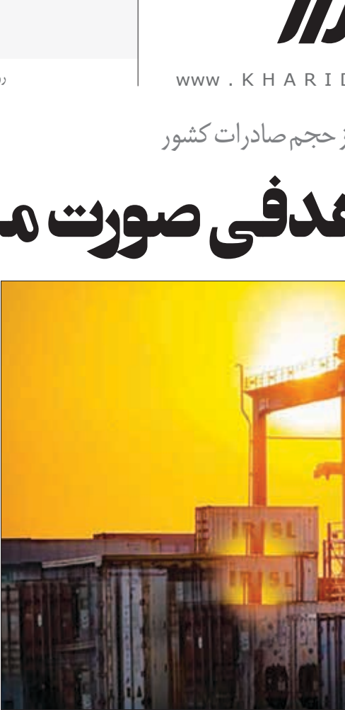
نقش ۲درصدی مناطق آزاداز حجم صادرات کشور