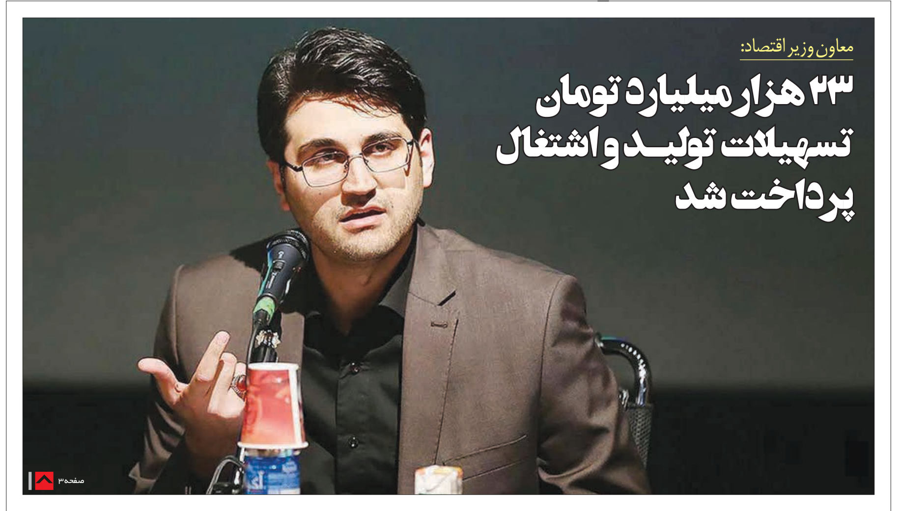
معاون وزیر اقتصاد:

۲۳ هزار میلیارد تومان تسهیلات تولید و اشتغال پرداخت شد