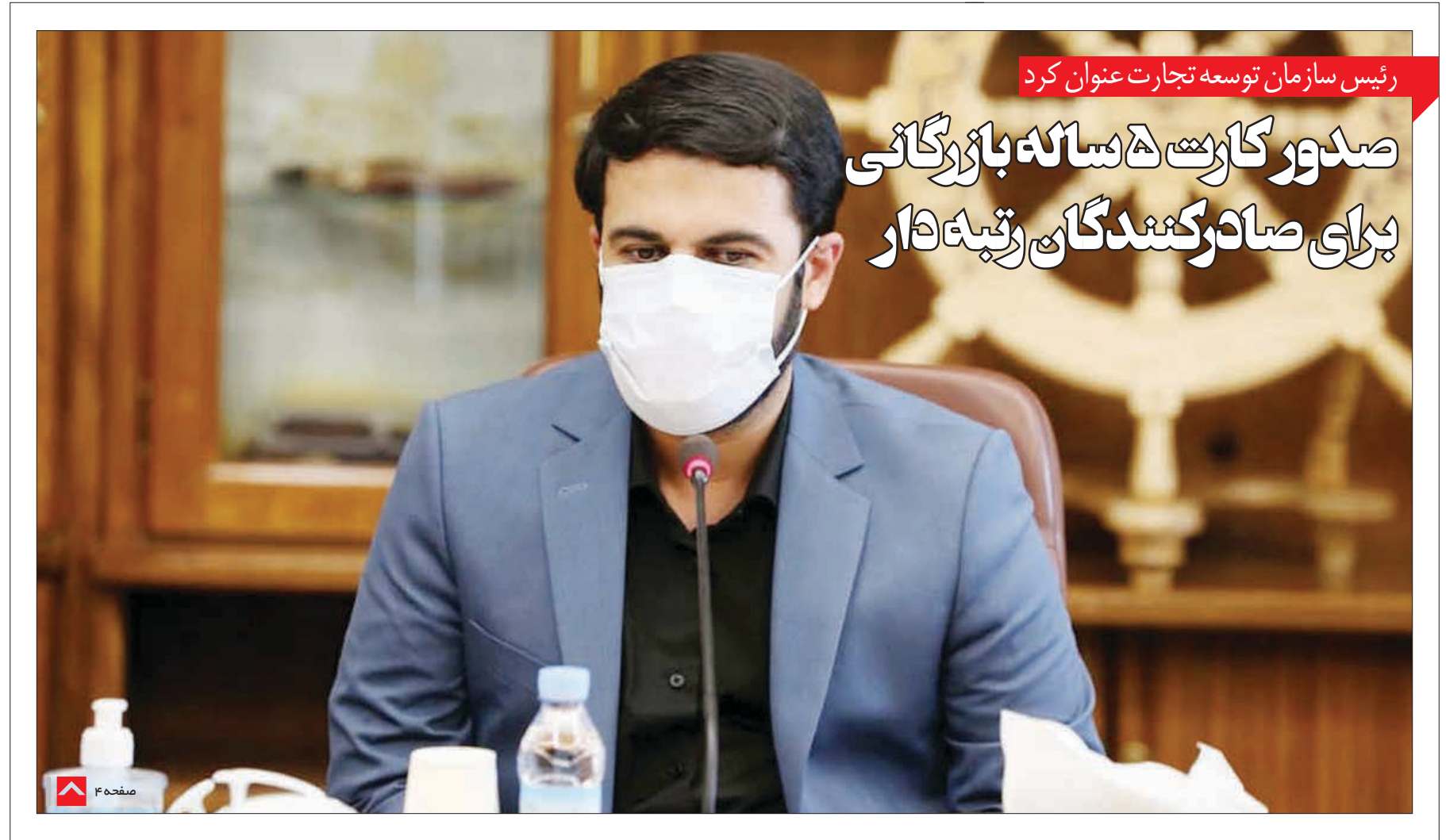
رئیس سازمان توسعه تجارت عنوان کرد