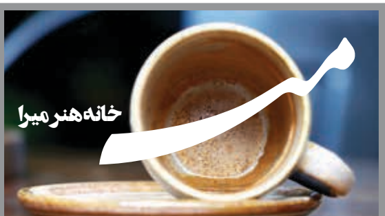
فلسطین جنوبی، لیافی نژاد، کاشی ۸۷ @miraarhouse

پایگاه خبری خردیدار WWW.KHARIDAARONLINE.IR پایگاه تحلیلی خرداروز WWW.ROOZLINE.IR پایگاه هنری اجرارو WWW.EJRAARO.IR