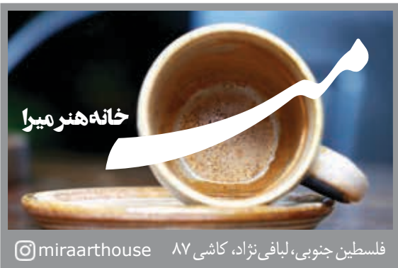
فلسطین جنوبی، لیبافی نژاد، کاشی ۸۷ @miraarhouse

هفته آینده پرداختی به گندمکاران را به روز کنیم. وی در ادامه اظهار کرد: ۱۵ هزار میلیارد تومان توسط بانک کشاورزی تامین شده و قرار است ۱۵ هزار میلیارد تومان دیگر هم توسط سایر بانک ها تامین شود و مابقی نیز توسط سازمان برنامه تامین خواهد شد. در تلاش هستیم که خودمان است که از شهر یور ماه آغاز خواهد شد. ساداتی نژاد در پایان گفت: از همه گندمکاران بابت تاخیر در پرداخت عذر خواهی کرد.