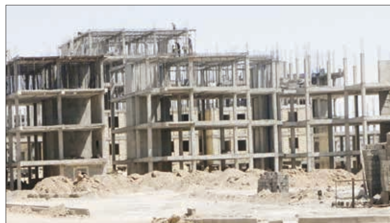
از سوی وزارت راه و شهرسازی

خریدار وزارت راه و شهرسازی اعلام کرد: تا تیرماه ۱۴۰۱ عملیات ساخت یک میلیون و ۳۸۳ هزار و ۵۱۳ واحد آغاز شده که از این تعداد، ۹۵۴ هزار و ۲۳۸ واحد مسکونی در مراحل مختلف پیشرفت فیزیکی و ساخت قرار دارد و تعداد ۴۲۹ هزار و ۲۷۵ واحد نیز کلنگ‌زنی شده است. وزارت راه و شهرسازی، عملکرد حوزه مسکن و ساختمان در دولت سیزدهم، حوزه اجرای طرح نهضت ملی مسکن همراه با پیش‌نیاز اجرایی آن از جمله تامین اراضی، تامین مالی، تامین مصالح ساختمانی، تامین خدمات و سایر موارد را اعلام کرد.