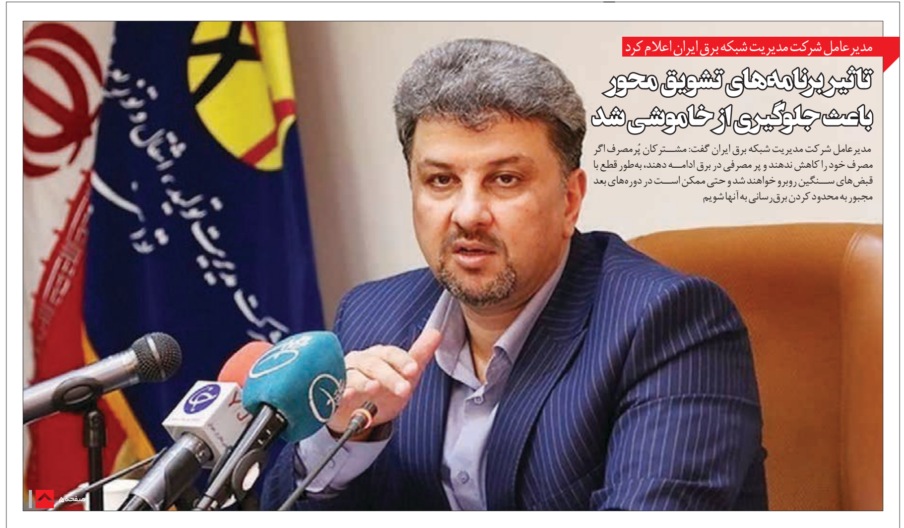
مدیر عامل شرکت مدیریت شبکه برق ایران اعلام کرد