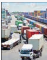
کریدور شمال- جنوب

همچنین در خصوص روان سازی و ایجاد تسهیلات برای رانندگان حمل‌ونقل جاده‌ای، ایجاد هاب‌های لجستیکی در بنادر ایران، ایجاد مقدمات لازم جهت سرمایه‌گذاری در بنادر دو کشور، بررسی امکان ایجاد شرکت‌های مشترک کشتیرانی و سایر همکاری طرفین جهت افزایش توان حمل‌ونقلی با حمایت بخش خصوصی در جهت افزایش ظرفیت برای