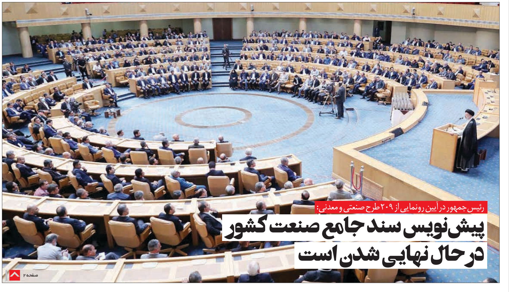
رئیس‌جمهور در آیین رونمایی از طرح صنعتی و معدنی:

در نوبت آگهی مزایده عمومی فروش واگذاری املاک شماره ۱۳۰۱/۹-۱۴۰۱ اداره کل راه و شهرسازی استان گیلان به شماره شناسه ۱۳۴۳۳۴ که در تاریخ ۱۴۰۱/۰۱/۱۱ در روزنامه خریدار منتشر شده است نوبت اول ذکر نگردیده است که بدینوسیله اصلاح می‌گردد.