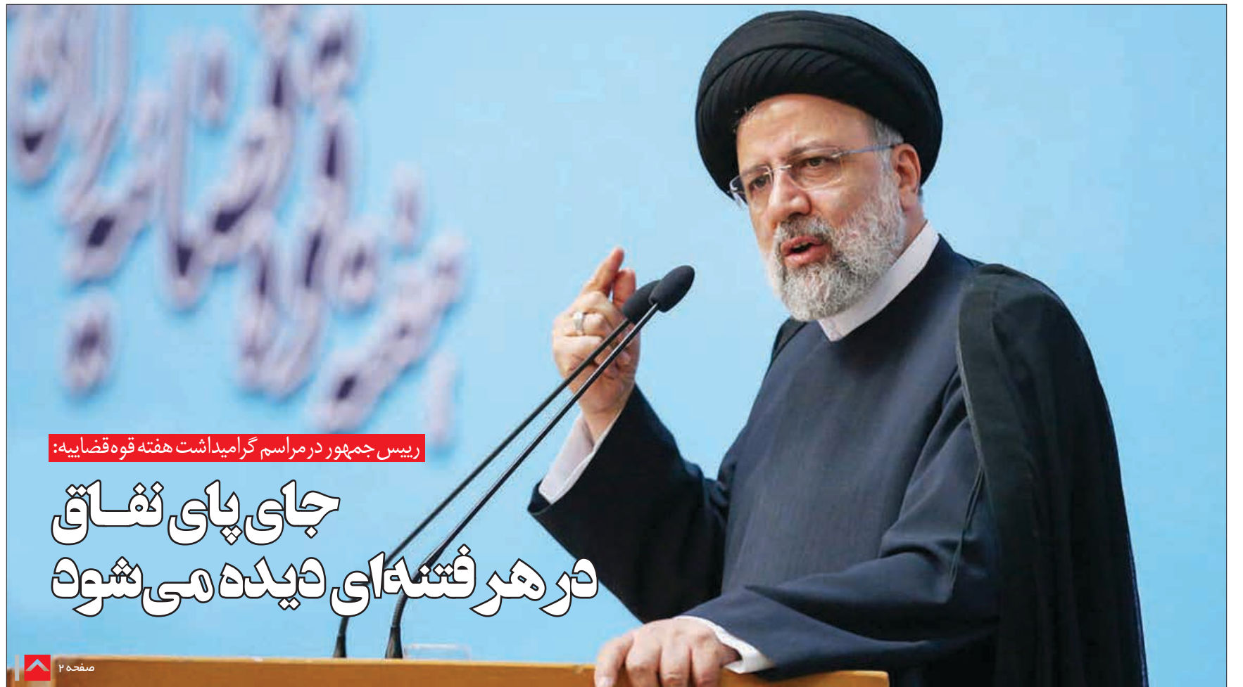
رئیس جمهور در مراسم گرامیداشت هفته قوه قضاییه: