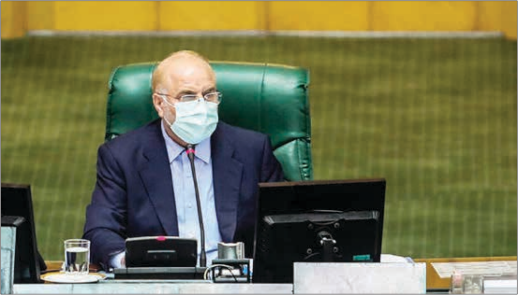
محمد باقر قالیباف در مجلس شورای اسلامی