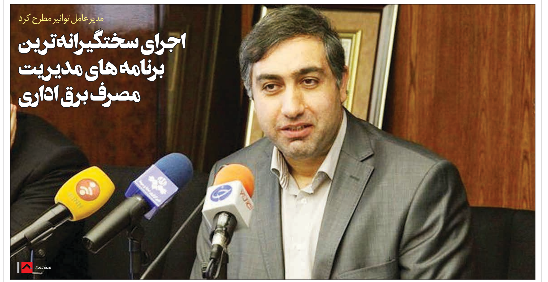
مدیر عامل توانیر مطرح کرد