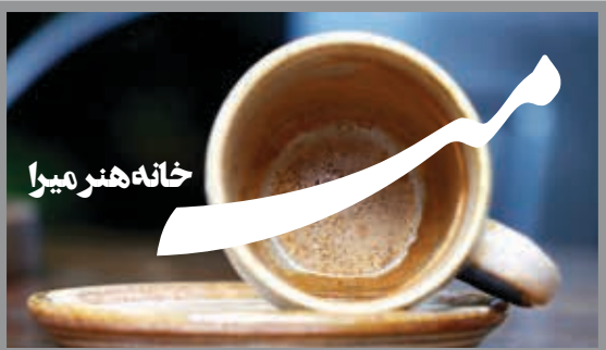
فلسطین جنوبی، لیافی نژاد، کاشی ۸۷ @miraarhouse

پیام رهبر انقلاب برای درگذشت حجت‌الاسلام دعایی رهبر معظم انقلاب: صفا و سلامت نفس از صفات پسندیده حجت‌الاسلام دعایی بود