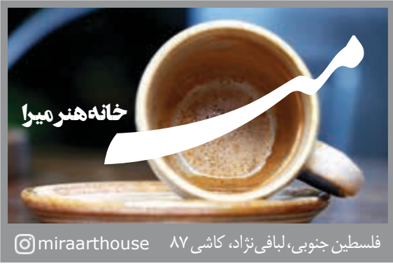
فلسطین جنوبی، لیافی نژاد، کاشی ۸۷ @miraarhouse

سامانه فروش یکپارچه خودرو در مدار ثبت نام