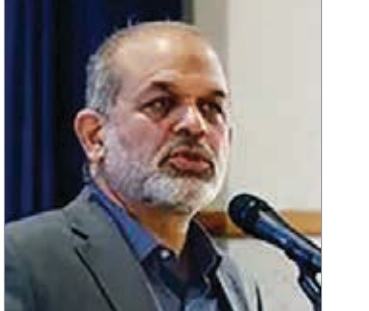
امیر دربادار سیاری

مرقد امام خلاصه کرد. چه دستورالعملی در این زمینه به مدارس ابلاغ شده است؟ در وزارت علوم چه برنامه مشخصی و چه حرف‌ها و گفتگو‌هایی برنامه ریزی شده است؟ باید در این حوزه‌ها برنامه‌های مهم داشته باشیم.