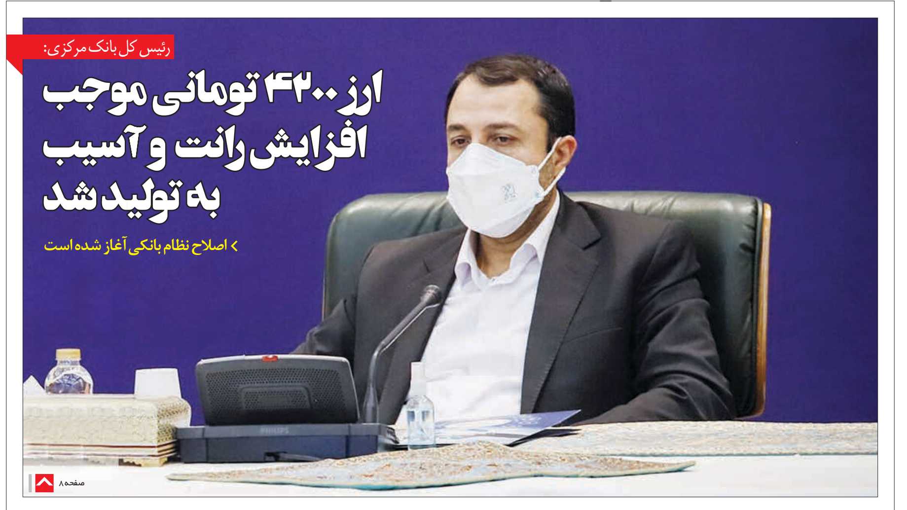
رئیس کل بانک مرکزی: