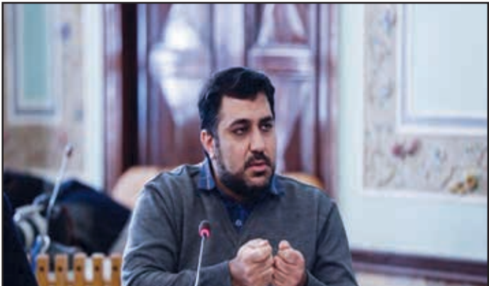
تصویب در صحن علنی شورای اسلامی شهر اصفهان مورد بررسی قرار می‌گیرد.

وی افزود: در این زمان، بازنیستگان، جانبازان، معلولان، زنان سرپرست خانوار و سالمندان مشمول این طرح می‌شوند و خدماتی از جمله استفاده از مراکز فرهنگی، فرهنگسراها و مراکز تفریحی و گردشگری به اعضای دارای کارت ارائه