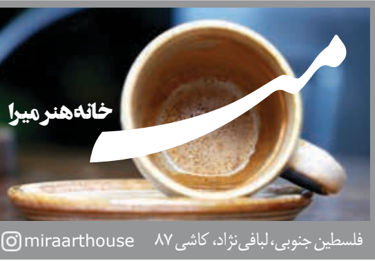
فلسطین جنوبی، لیبافی نژاد، کاشی ۸۷ @miraarhouse

منفعت این سرمایه گذاری چیست؟ وی در رابطه با اینکه این تزریق پول چه منفعتی برای صندوق توسعه ملی دارد و سرانجام این ۱۲ هزار میلیارد تومان چه خواهد شد، یادآور شد: این مبلغ به صورت قرارداد پنج ساله و در چند قرارداد پیش بینی شده است که قابلیت تمدید دارد به طوری که هر ۶۵۰ میلیارد تومان قراردادی جداگانه دارد و از زمان انعقاد، پنج سال بعد سررسید خواهد شد. در ازای این سرمایه گذاری نیز سود ثابت شده ای در