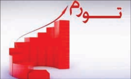
مدیر کل بهره برداری آزادراهها:

وی با اشاره به این که روند، متعادل، خوب و مثبت شاخص بورس و کلیت بازار سرمایه به نوعی در حال پیشخور کردن تورم سال ۱۴۰۱ است، اضافه کرد: به طور معمول در بورس سهامداران خبرها را می‌خرند و اخبار و اتفاقات آینده را پیشخور می‌کنند؛ و به همین دلیل هم از ابتدای امسال به دلیل شرایط تورمی اقتصاد شاهد این هستیم که شاخص بورس و کلیت بازار سرمایه روند متعادل و مثبتی برخوردار شده‌اند. این کارشناس بازار سرمایه اظهار امیدواری کرد: روزی برسد که به دلیل افزایش بهروری و کارایی در نگاه‌های تولیدی و همچنین رشد و رونق اقتصاد کشور شاهد افزایش شاخص بورس و روند صعودی کلیت بازار سرمایه باشیم.