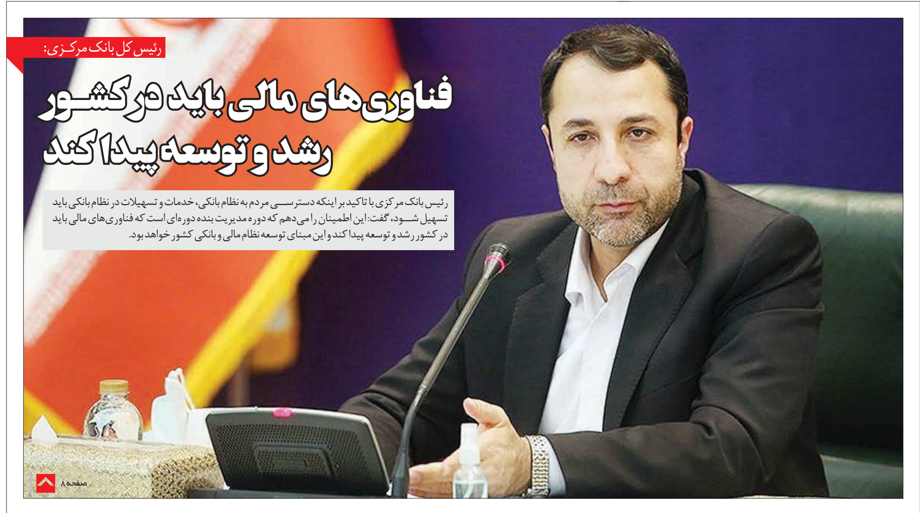
رئیس کل بانک مرکزی: