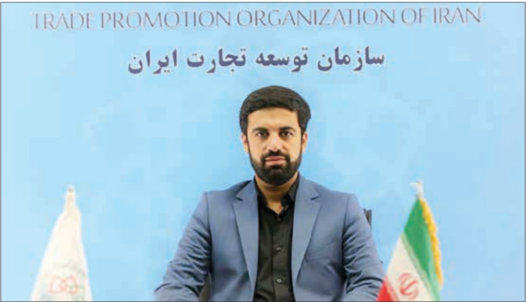
محمدجواد حاجی حسینی، معاون وزیر صمت و رئیس کل سازمان توسعه تجارت ایران

تجارت ایران با بیان اینکه برخی محصولات در داخل کشور بازار ندارد اما در کشورهای دیگر کالای استراتژیک محسوب می‌شود، گفت: از همین رو تلاش کردیم تغییر رویکرد داشته باشیم و زنجیره‌های تأمین و تولید برای صادرات تکمیل شود.