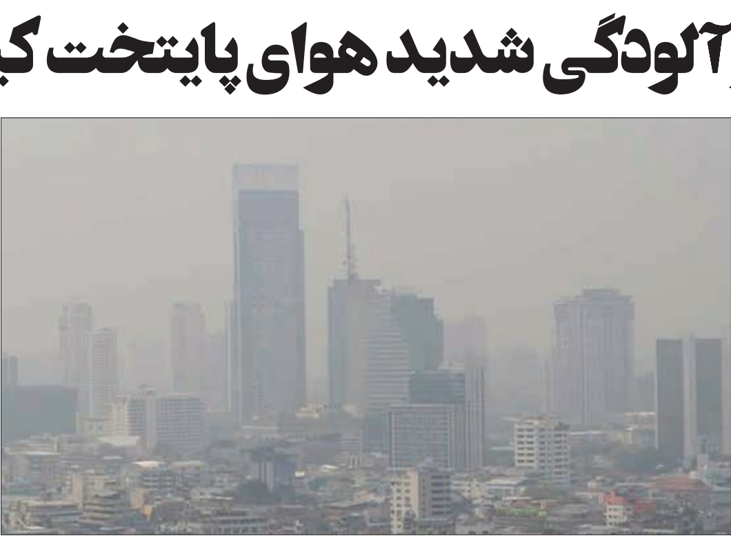
آلودگی هوای تهران در روزهای سرد زمستان