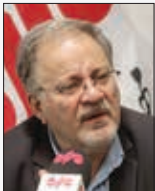
مدیر عامل شرکت پتروشیمی پارس