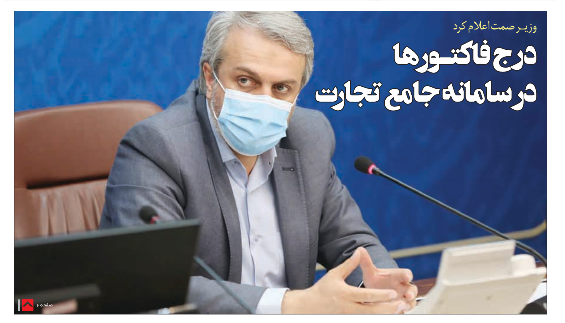
وزیر صمت اعلام کرد