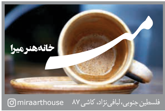
فلسطین جنوبی، لیبافی نژاد، کاشی ۸۷ @miraarhouse